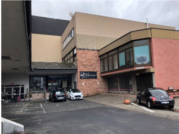
Abb. 4: Ansicht des Gebäudes im Südosten