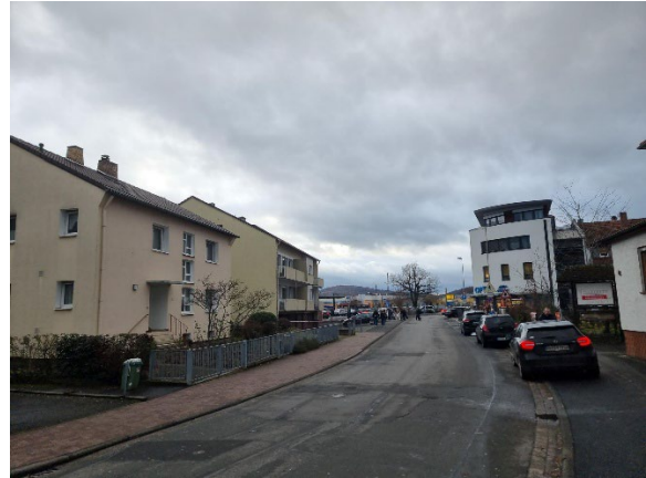
Abb. 5: Hailerer Straße, Blickrichtung Südwest