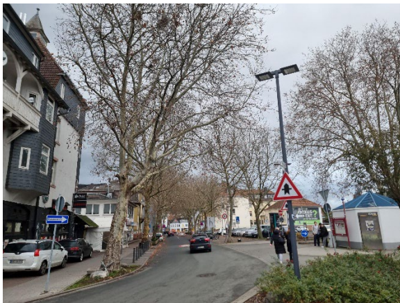
Abb. 8: Bahnhofstraße mit Platanenbeständen