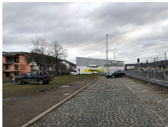
Abb. 2: Park+Ride Parkplatz westlich des Bahnhofs