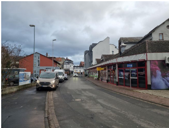
Abb. 6: Hailerer Straße, Blickrichtung Ost