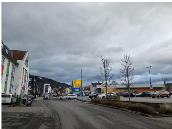
Abb. 10: Hailerer Straße Blickrichtung Bahnhofskreis