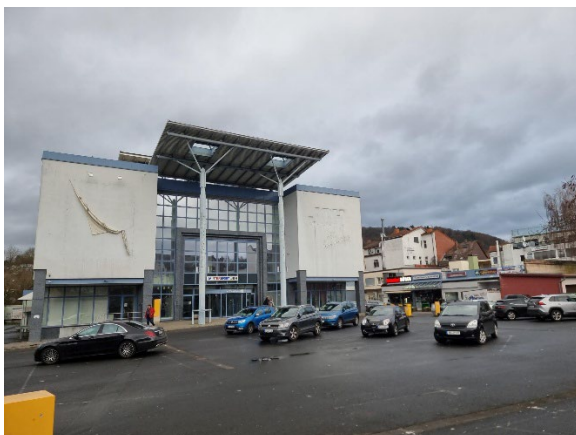
Abb. 2: Kaufhaus Joh mit vorgelagerter asphaltierter Parkplatzfläche im Süden

Die vorhandenen Lebensraumstrukturen sind in den folgenden Abbildungen dokumentiert.