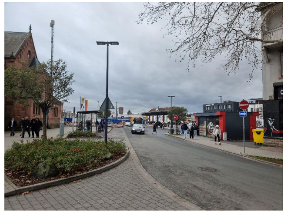
Abb. 7: Bahnhofsvorplatz