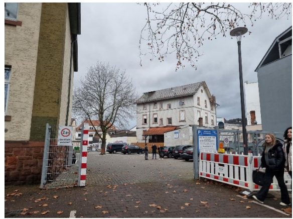
Abb. 9: Parkplatz Bahnhofstraße