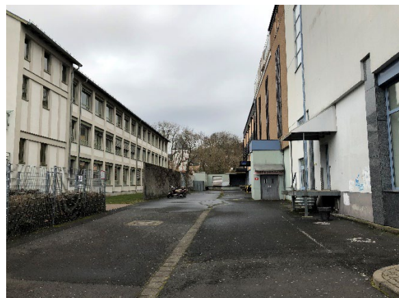
Abb. 3: Warenannahme und -abgabe im Westen